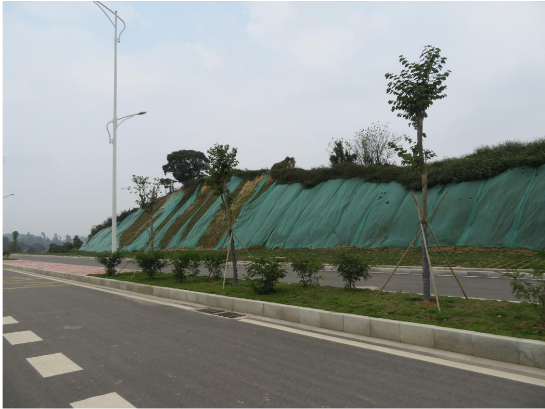
照片 5: 道路沿线现状