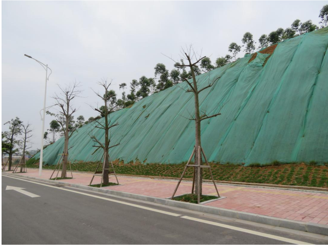
照片 7: 道路沿线现状