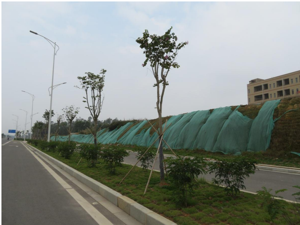
照片 2: 道路沿线现状