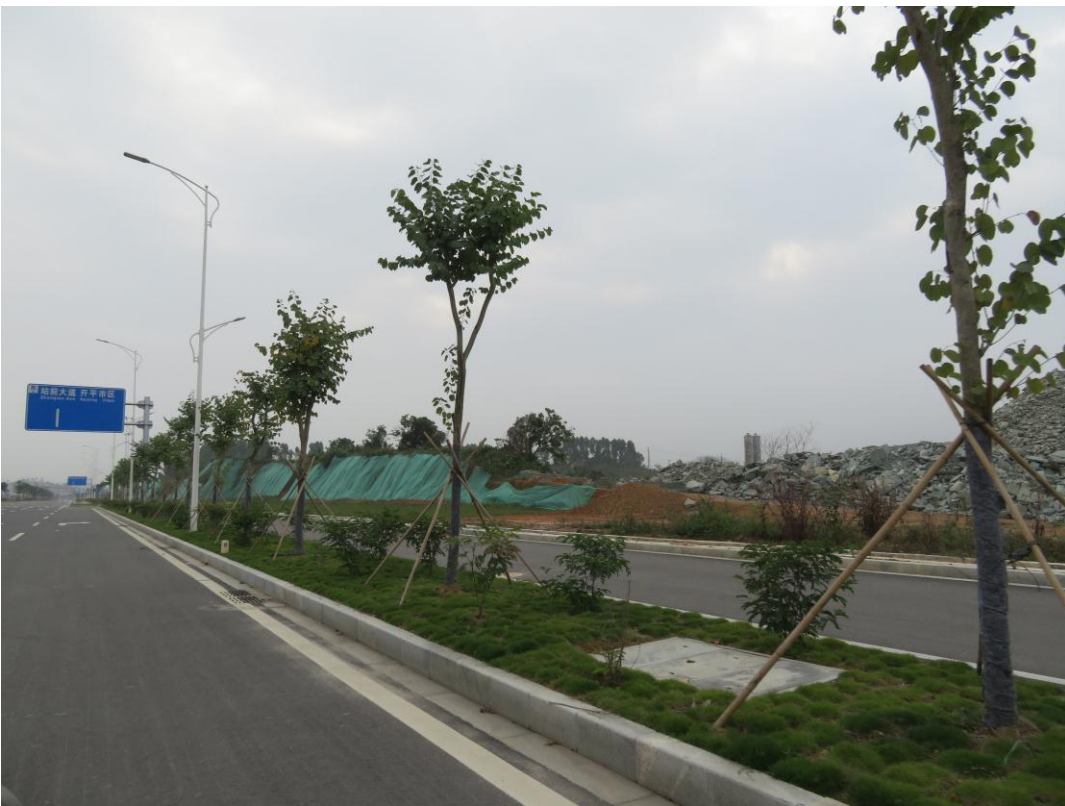
照片 12: 道路沿线现状