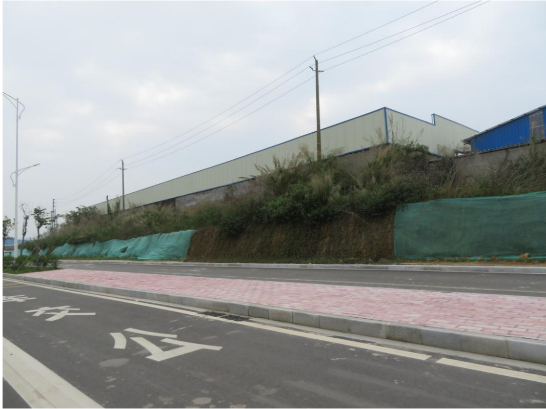
照片 11: 道路沿线现状