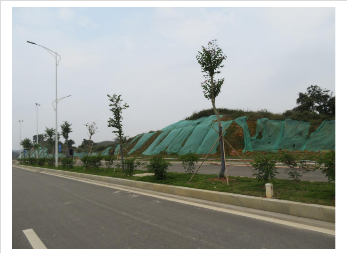
照片 4: 道路沿线现状