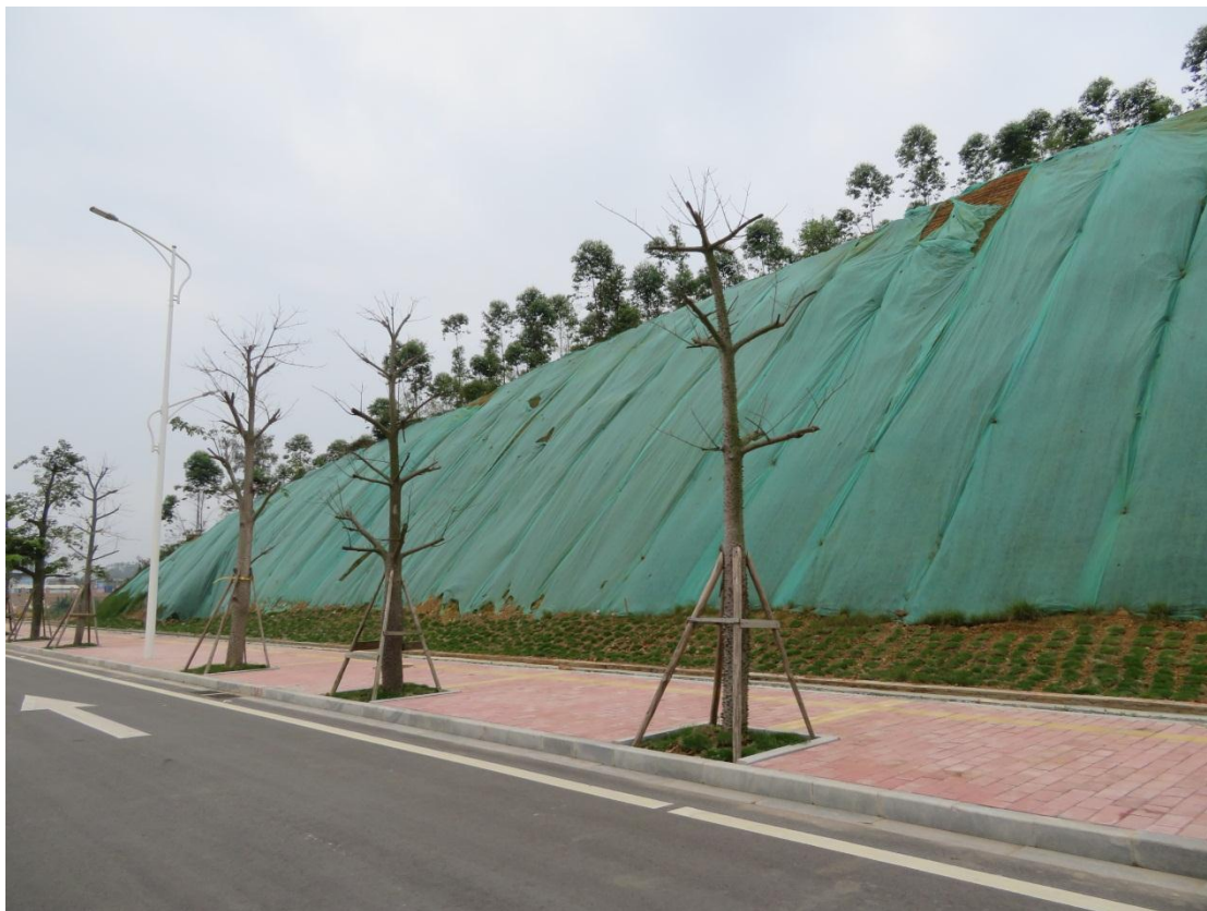
照片 7: 道路沿线绿化