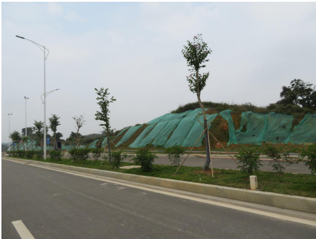
照片 5: 道路沿线绿化