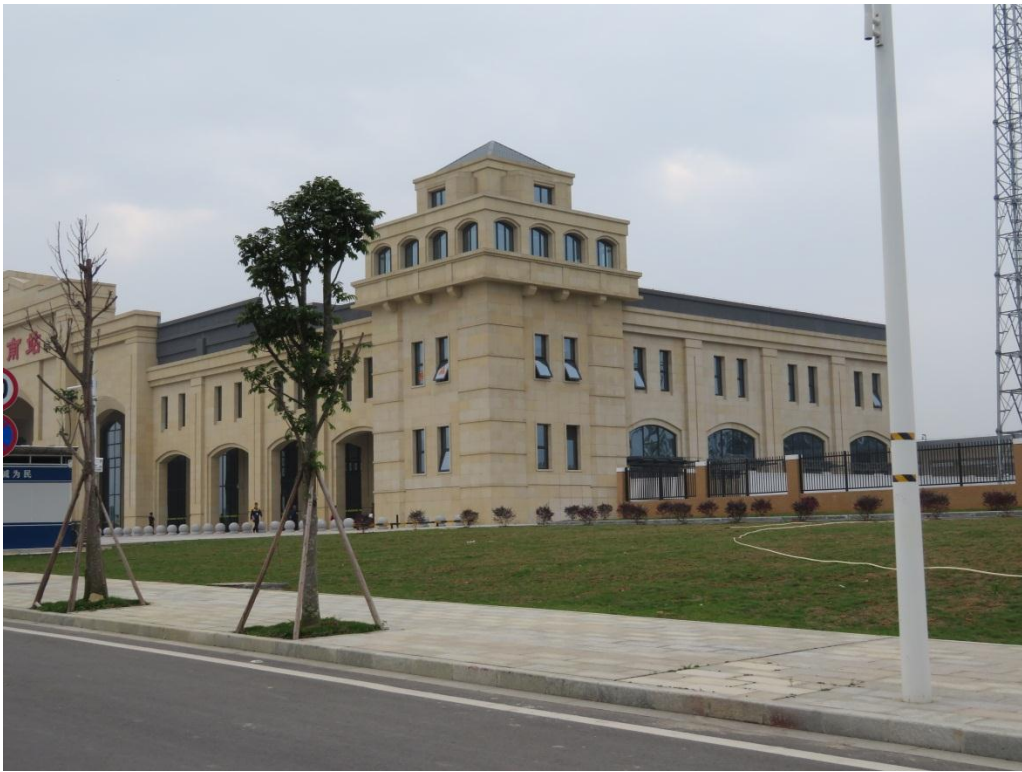
照片 1: 道路沿线现状