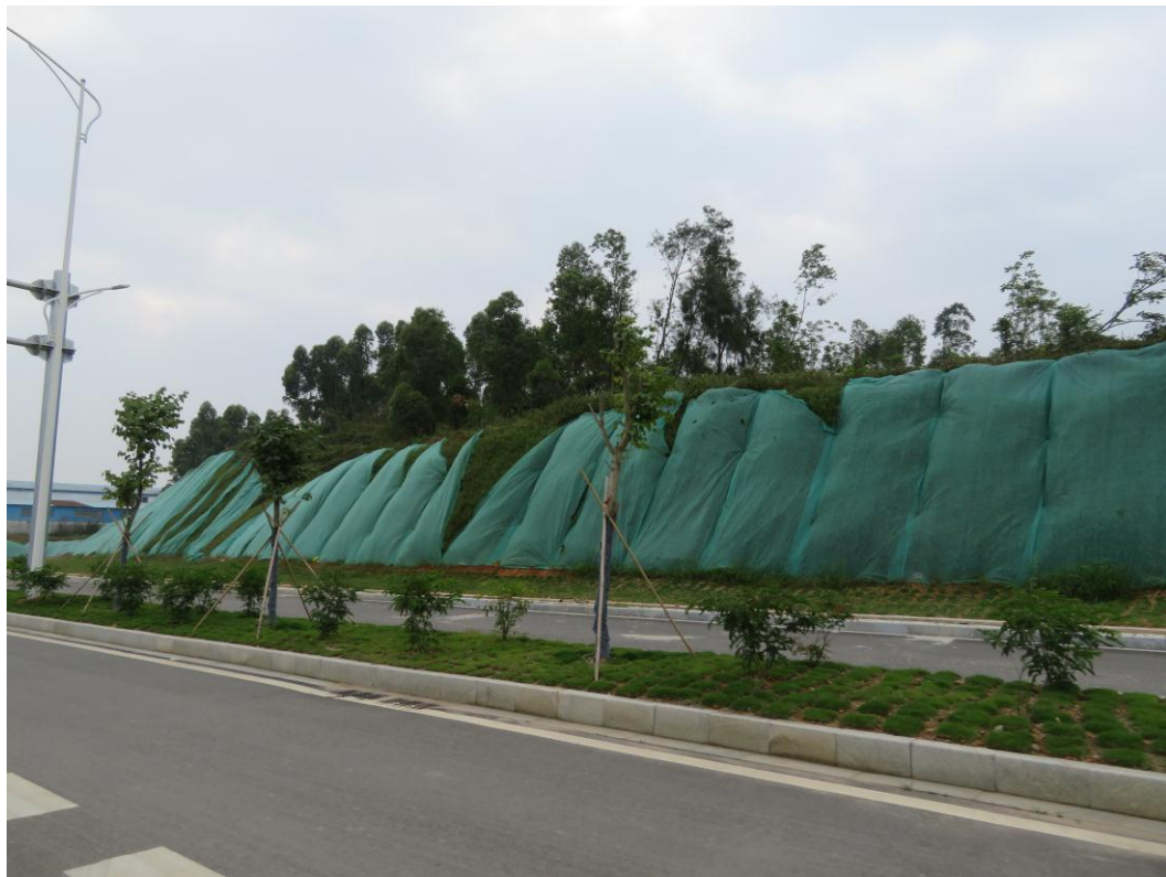
照片 8: 道路沿线现状