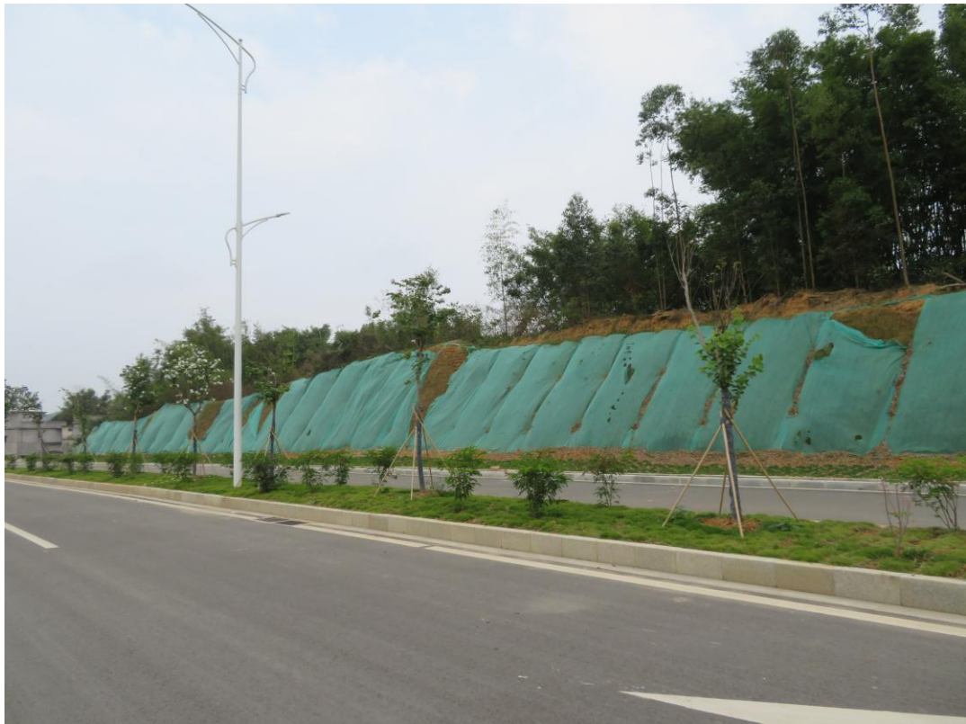
照片 6: 道路沿线现状