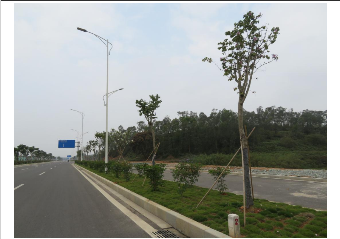
照片 3: 道路沿线现状