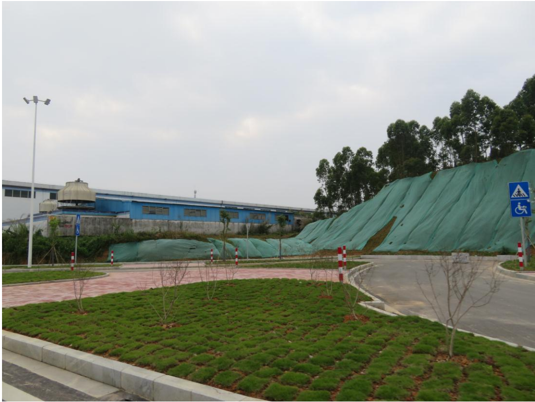
照片 9: 道路沿线现状