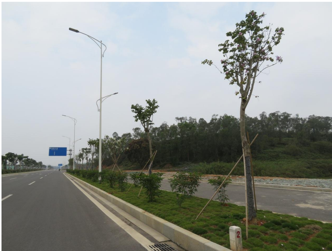
照片 3: 道路沿线绿化