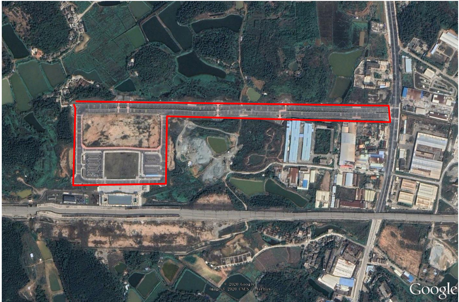
附图-02：项目建成后场地卫星影像图