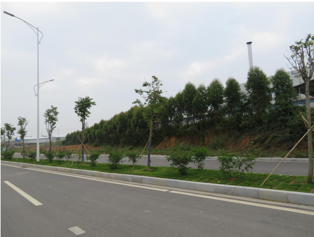
照片 10: 道路沿线现状