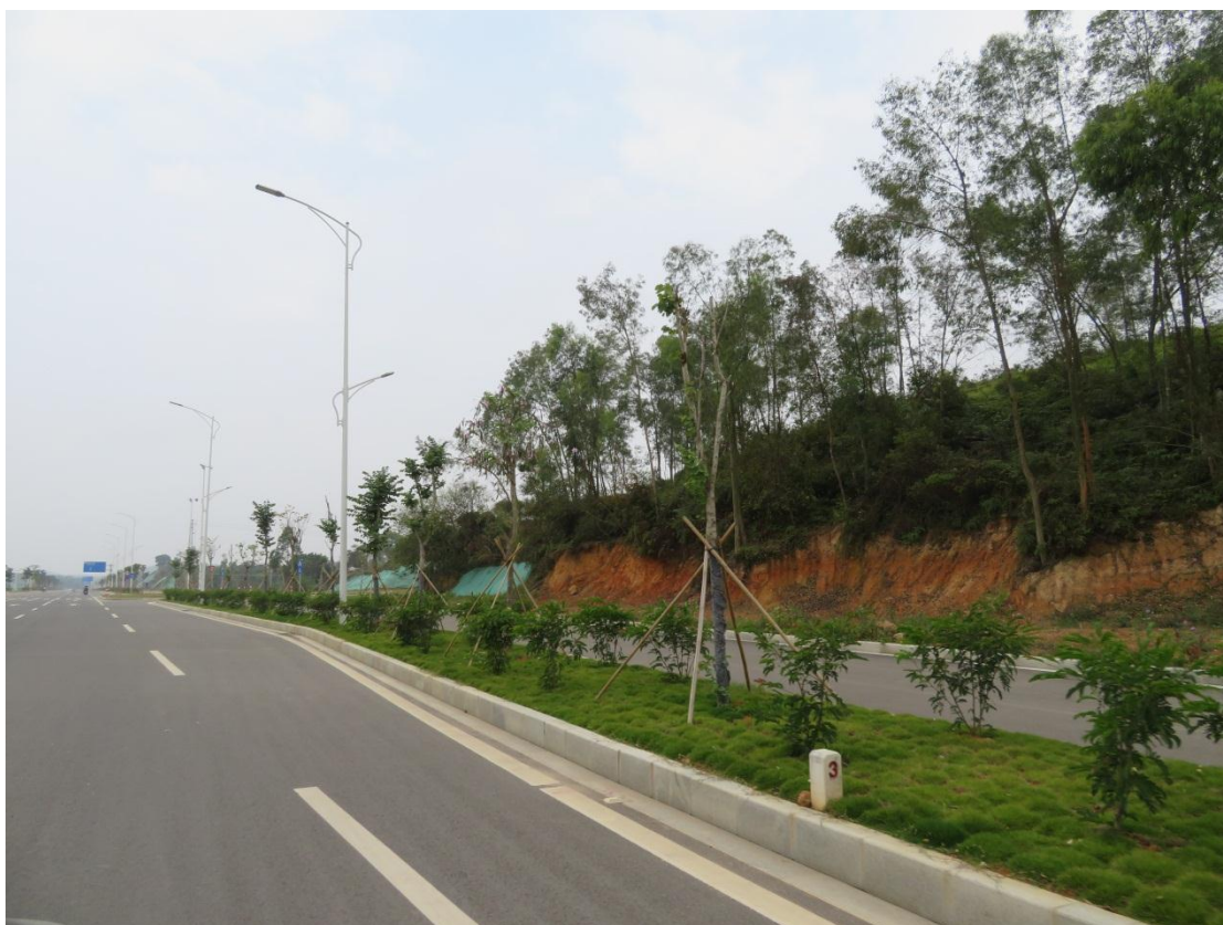
照片 4: 道路沿线绿化